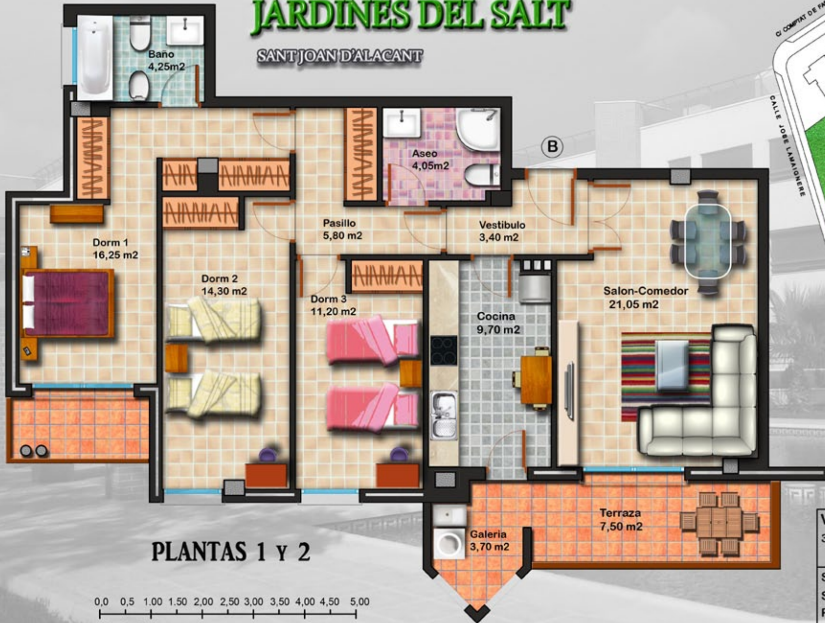
PLANTAS 1 Y 2

0,0 0,5 1,00 1,50 2,00 2,50 3,00 3,50 4,00 4,50 5,00 Escala Grafica